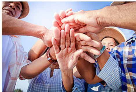
Elderly people have collaborated to meet, socialize, live happily in retirement.