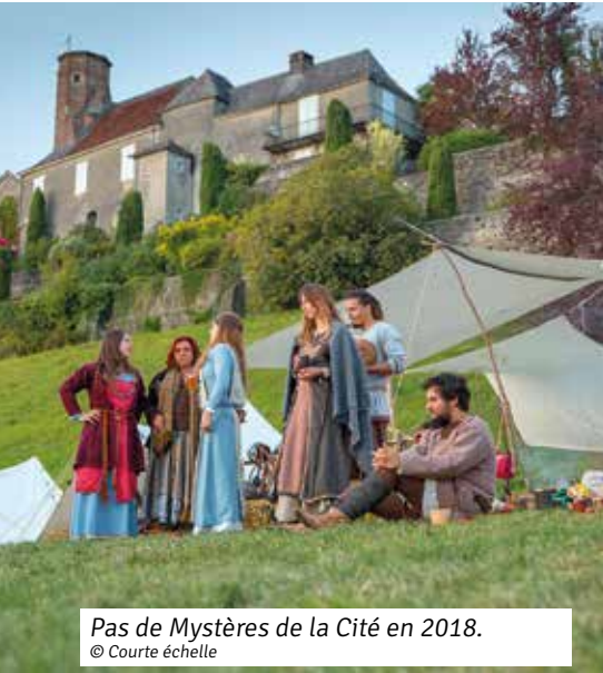
Pas de Mystères de la Cité en 2018.