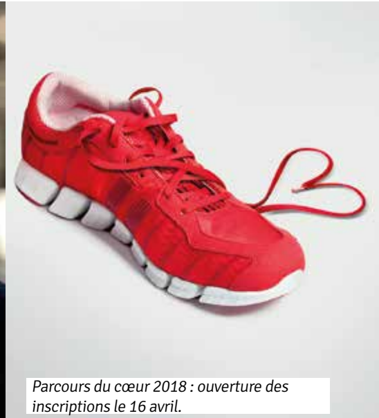
Parcours du cœur 2018 : ouverture des inscriptions le 16 avril.